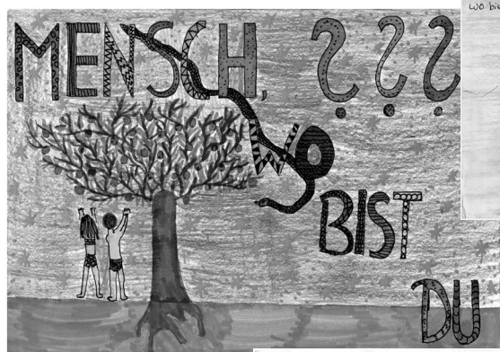
▲ Chiara, Gymnasium Wertingen

Ein herzliches Dankeschön geht an alle Jugendlichen, die auf diese Weise ihre Gedanken zu dieser bis heute drängenden Frage ausgedrückt haben.