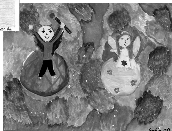
▲ Sofia, IKG, Kochawim