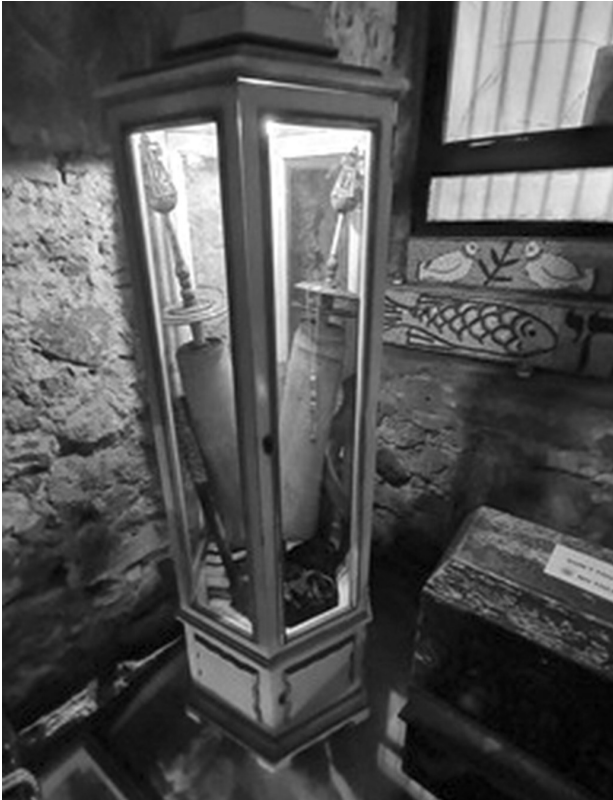
Yad, Mezuzot, Davidstern und eine Teller-sammlung

Er enthält heute zahlreiche religiöse Gegenstände, wie z.B. eine Thorarolle aus dem XVI. Jahrhundert,